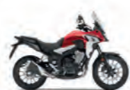
Grand Prix Red