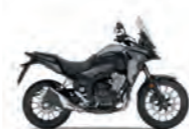
Mat Gunpowder Black Metallic