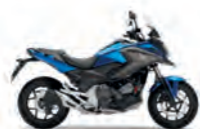
Glint Wave Blue Metallic