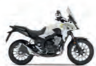
Pearl Metalloid White