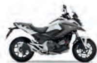
Pearl Glare White