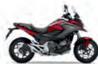
Candy Chromosphere Red