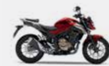
Candy Chromosphere Red / Force Silver Metallic