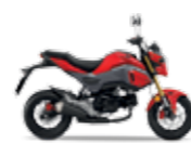
Pearl Valentine Red