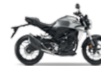
Mat Crypton Silver Metallic