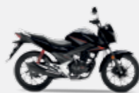
Onyx Blue Metallic