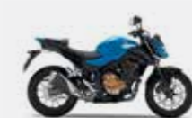
Candy Caribbean Blue Sea / Mat Black