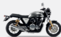
Digital Silver Metallic