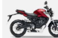
Candy Chromosphere Red