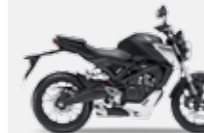
Mat Axis Grey Metallic