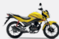
Pearl Twinkle Yellow