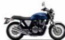
Pearl Hawkseye Blue