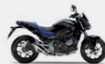
Graphite Black / Blue Metallic