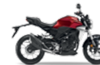
Candy Chromosphere Red