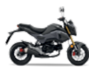
Mat Axis Grey Metallic