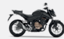
Mat Gunpowder Black Metallic