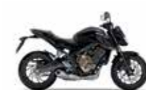
Mat Gunpowder Black Metallic