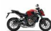
Candy Chromosphere Red