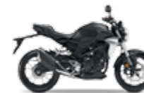
Mat Axis Grey Metallic