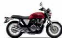
Candy Chromosphere Red