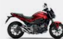
Candy Chromosphere Red