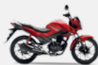
Candy Blazing Red