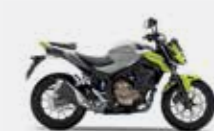
Force Silver Metallic / Lemon Ice Yellow