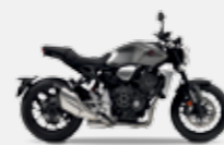
Mat Bullet Silver Metallic