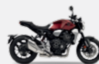
Candy Chromosphere Red