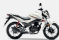
Pearl Sunbeam White