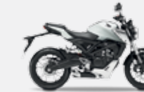
Pearl Metalloid White