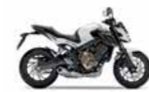
Pearl Metalloid White