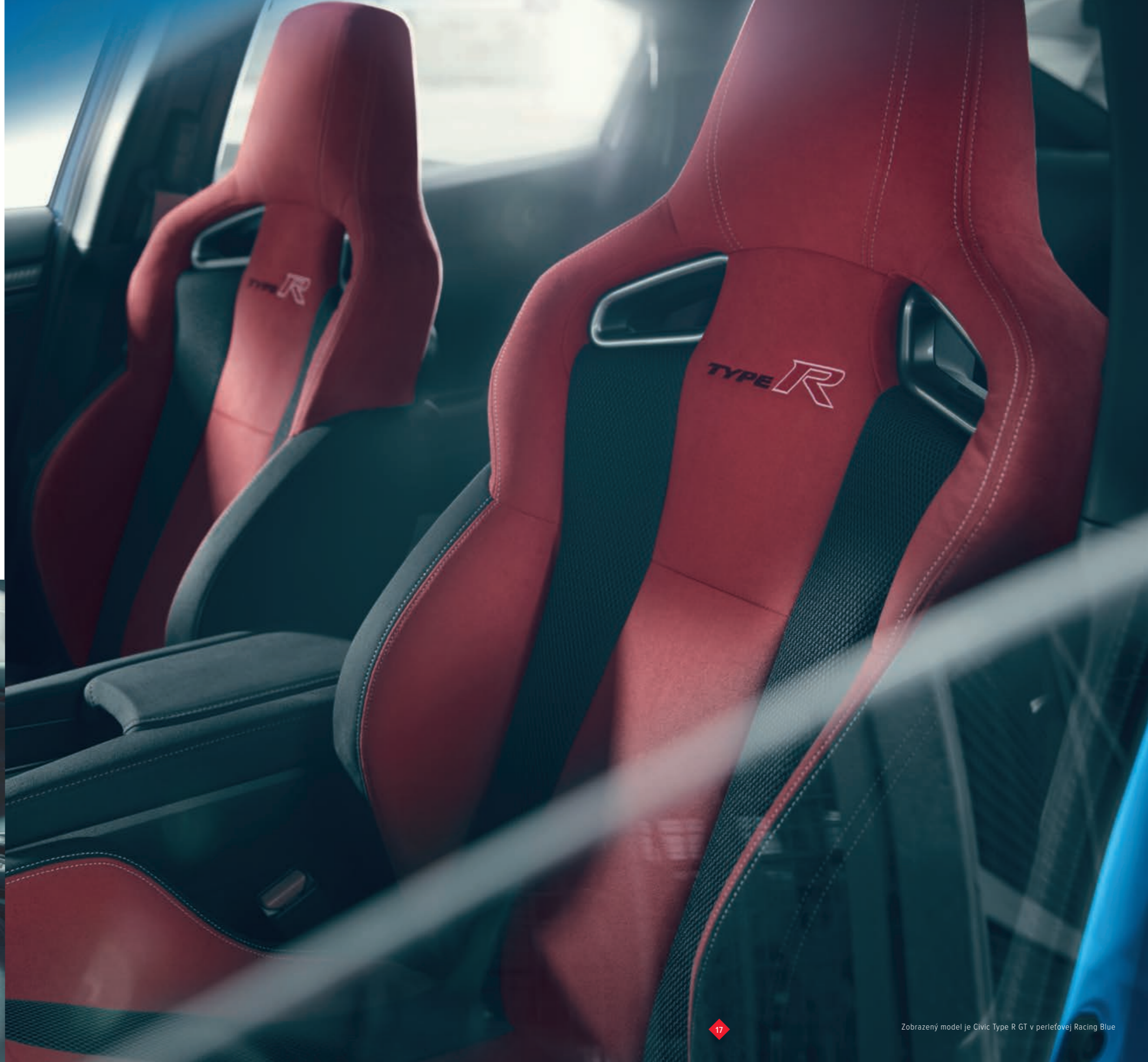
Zobrazený model je Civic Type R GT v perleťovej Racing Blue