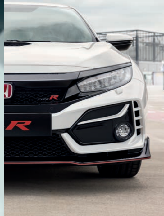
PRÉMIOVÁ CHAMPIONSHIP WHITE

Vytvorili sme celý rad farieb, ktoré zvýrazia tvar karosérie modelu Type R, a ktoré súčasne odkazujú na jeho pretekársky pôvod. Vyjadrite farbou svoj názor, je to na vás!