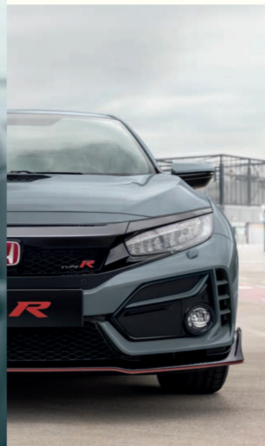
PERLEŤOVÁ SONIC GREY