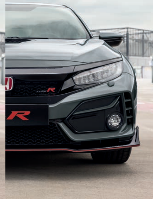
METALICKÁ POLISHED METAL