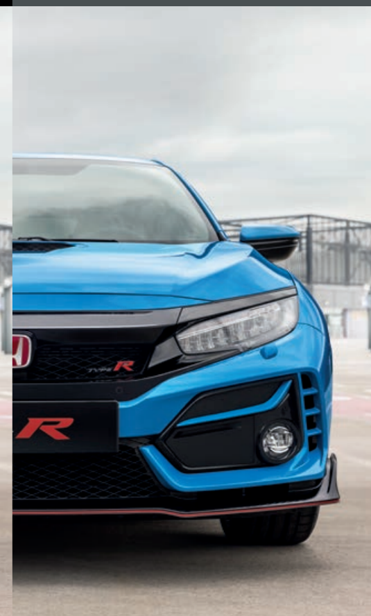
PERLEŤOVÁ RACING BLUE