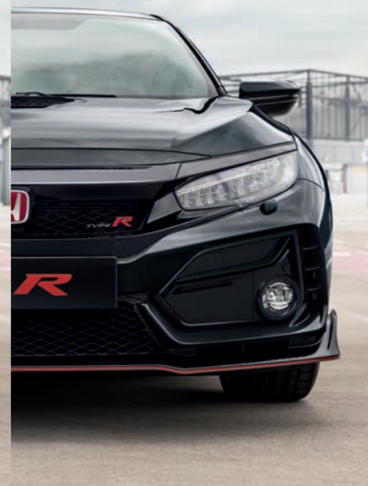
PERLEŤOVÁ CRYSTAL BLACK