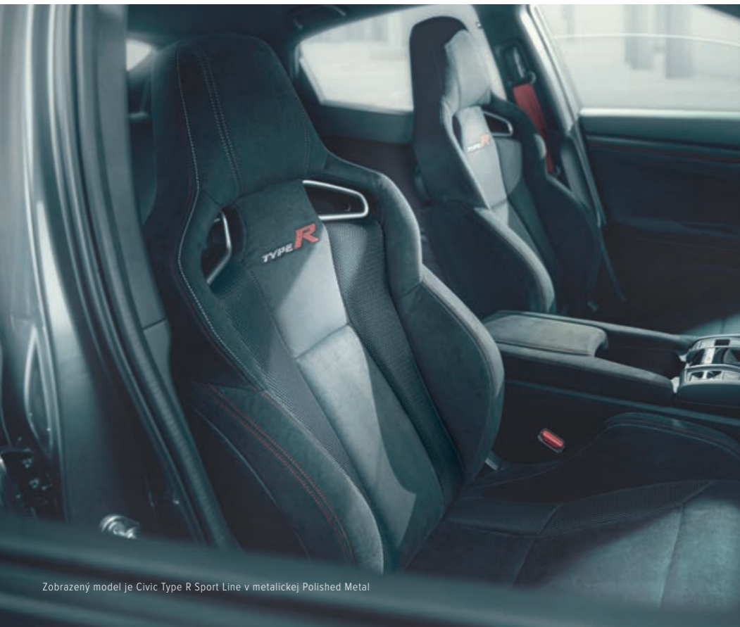
Zobrazený model je Civic Type R Sport Line v metalickej Polished Metal

— Napriek tomu, že môže pôsobiť ako pretekárske vozidlo, je výborne vybavené pre maximum pohodlia. V pretekársky ladenom kokpite si užijete špičkové materiály, automatickú klimatizáciu, tempomat, elektronickú parkovaciu brzdú a nový multimediálny systém Honda CONNECT 2 so 7-palcovým dotykovým displejom.