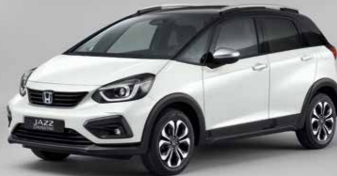
PERLEŤOVÁ PLATINUM WHITE