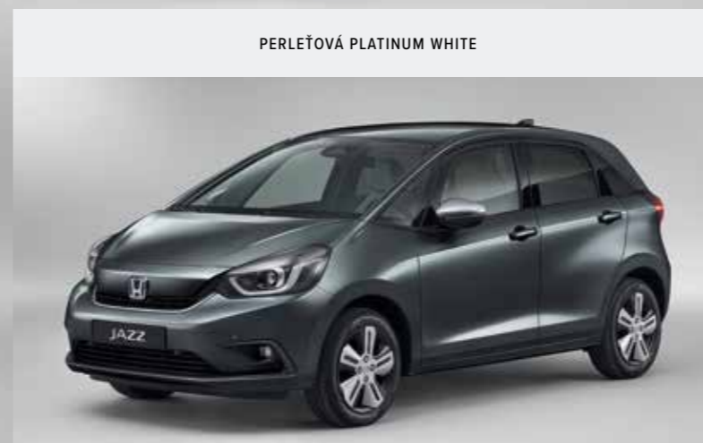
METALICKÁ SHINING GRAY