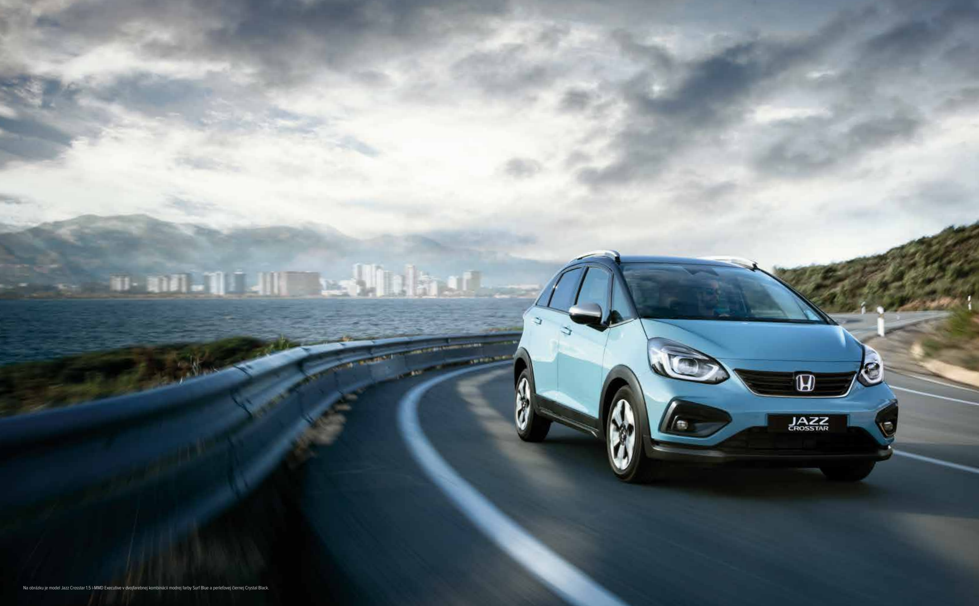
Na obrázku je model Jazz Crosstar 1.5 i-MMD Executive v dvojfarebnej kombinácii modrej farby Surf Blue a perleťovej čiernej Crystal Black.