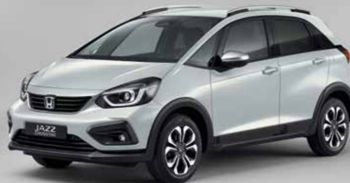
PERLEŤOVÁ PREMIUM SUNLIGHT WHITE