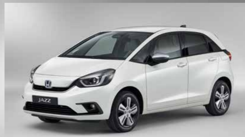
PERLEŤOVÁ PLATINUM WHITE