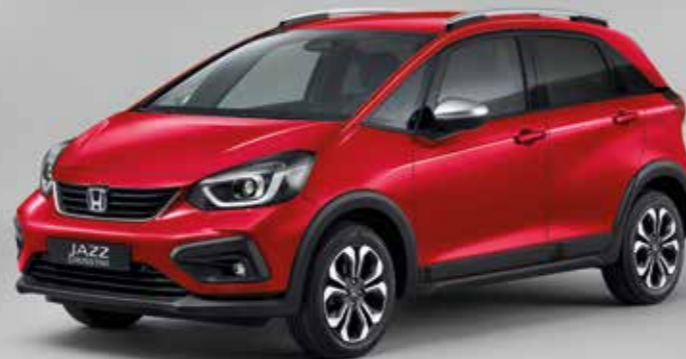
METALICKÁ PREMIUM CRYSTAL RED