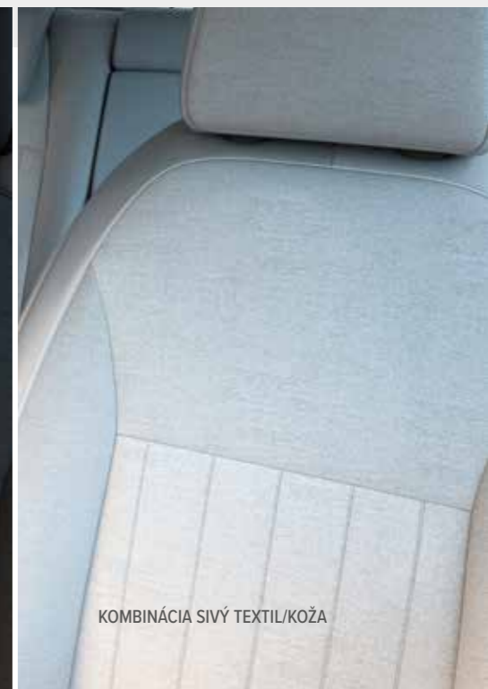
KOMBINÁCIA SIVÝ TEXTIL/KOŽA