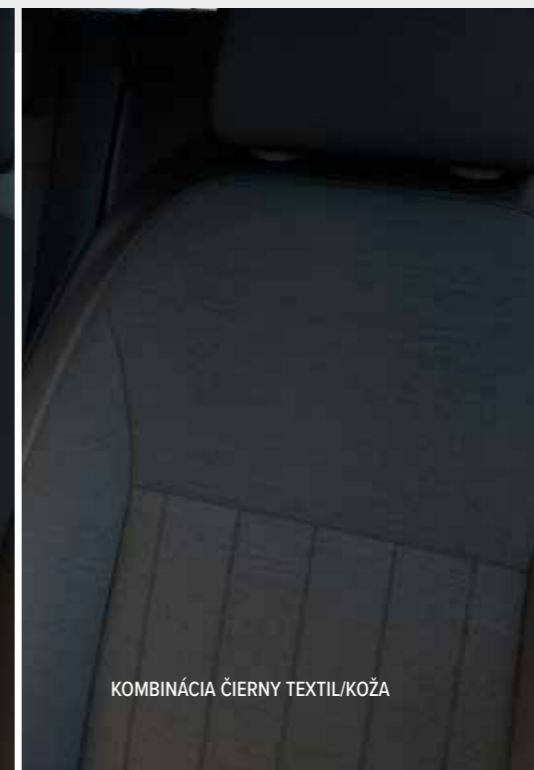
KOMBINÁCIA ČIERNY TEXTIL/KOŽA