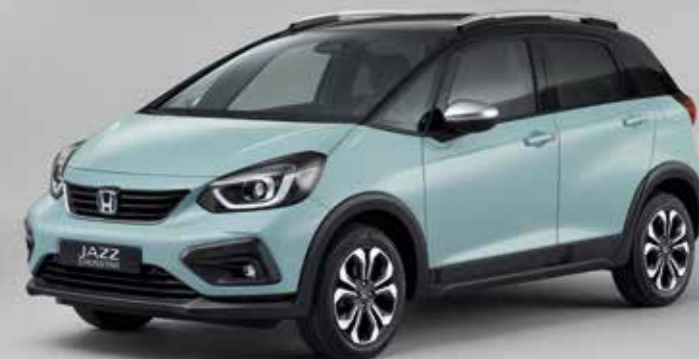
SURF BLUE S ČIERNOU STRECHOU