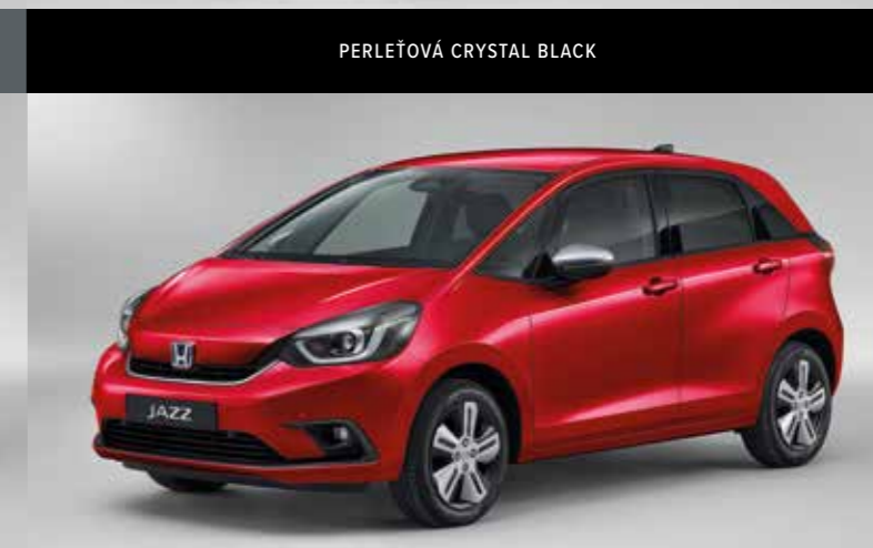
METALICKÁ PREMIUM CRYSTAL RED