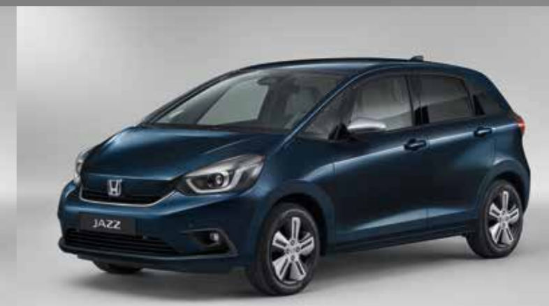
METALICKÁ MIDNIGHT BLUE BEAM