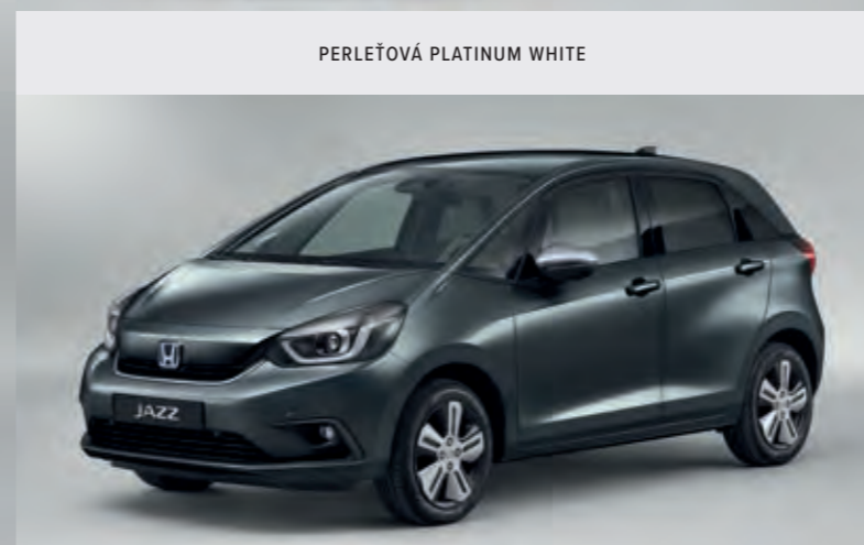
METALICKÁ SHINING GRAY