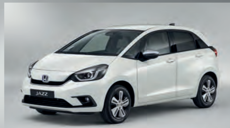
PERLEŤOVÁ PLATINUM WHITE