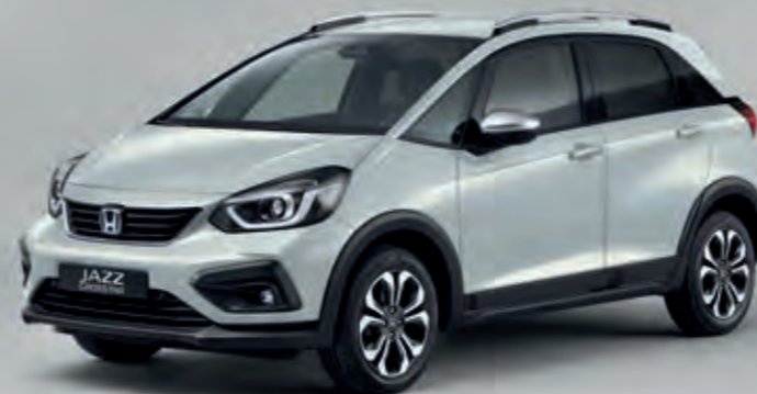
PERLEŤOVÁ PREMIUM SUNLIGHT WHITE