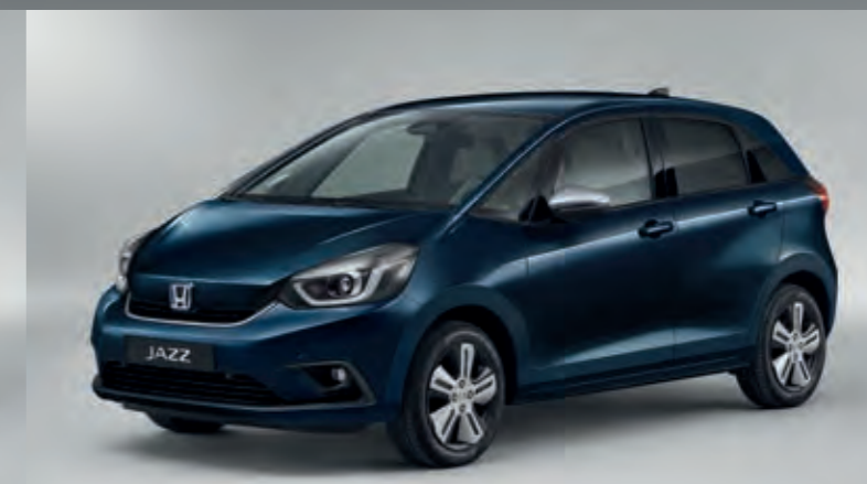
METALICKÁ MIDNIGHT BLUE BEAM