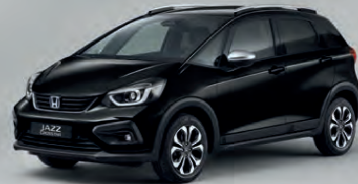
PERLEŤOVÁ CRYSTAL BLACK