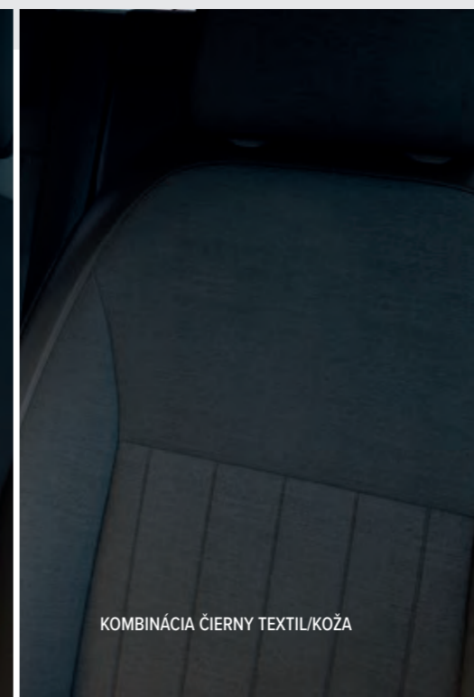
KOMBINÁCIA ČIERNY TEXTIL/KOŽA