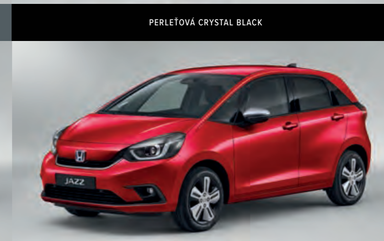
METALICKÁ PREMIUM CRYSTAL RED