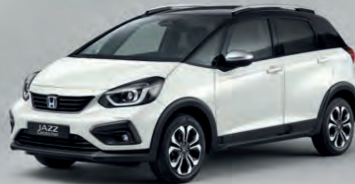
PERLEŤOVÁ PLATINUM WHITE