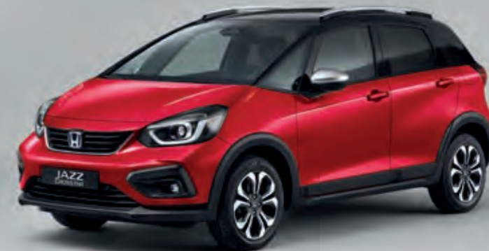
METALICKÁ PREMIUM CRYSTAL RED S ČIERNOU STRECHOU