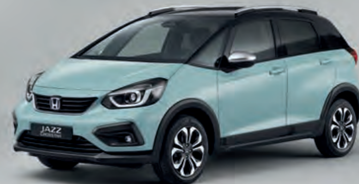
SURF BLUE S ČIERNOU STRECHOU