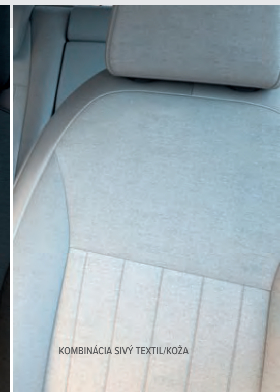
KOMBINÁCIA SIVÝ TEXTIL/KOŽA