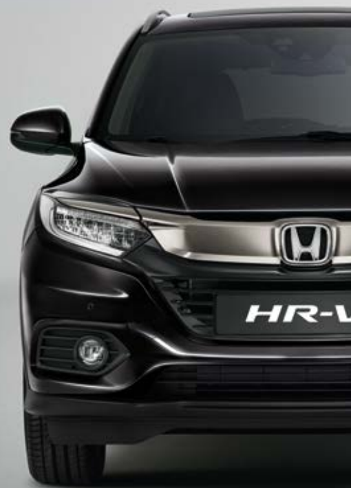
PERLEŤOVÁ CRYSTAL BLACK