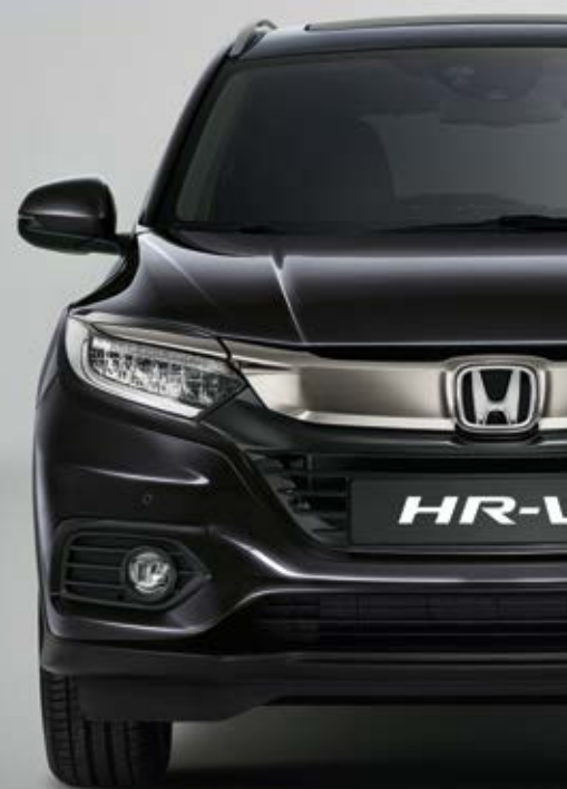
METALICKÁ RUSE BLACK