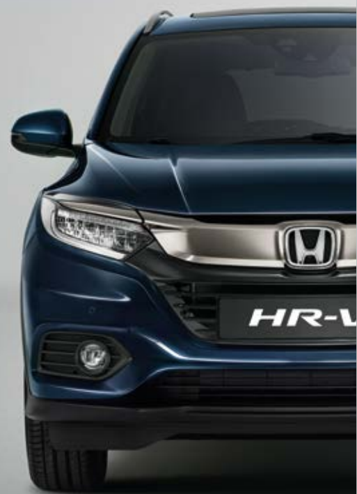
METALICKÁ MIDNIGHT BLUE BEAM

Vybrať si môžete z farieb, ktoré vyzerajú tak dobre, ako znejú. Od metalickej Midnight Blue Beam až po Milano Red – vyberte si tú, ktorá sa najlepšie hodí k vašej osobnosti.