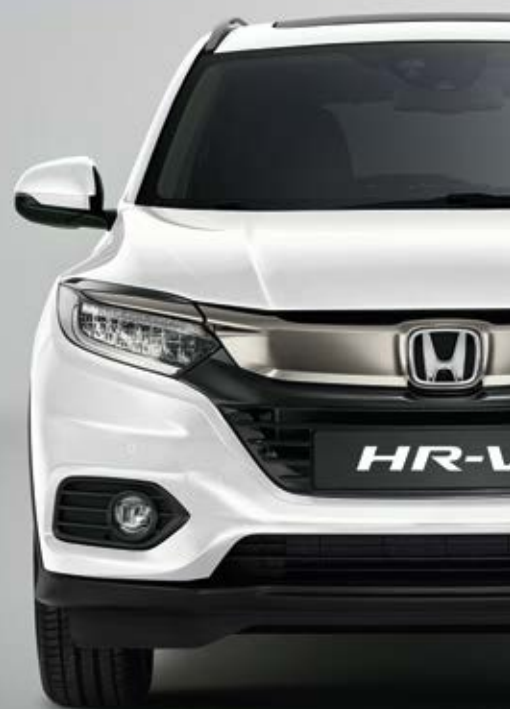
PERLEŤOVÁ PLATINUM WHITE