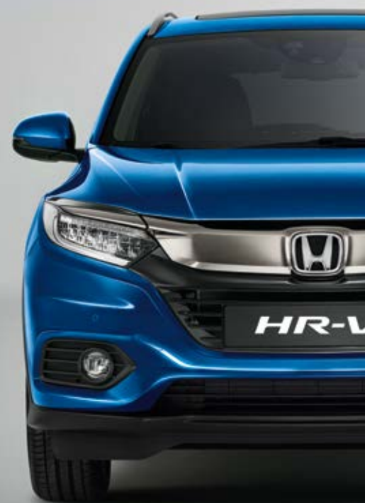
METALICKÁ BRILLIANT SPORTY BLUE