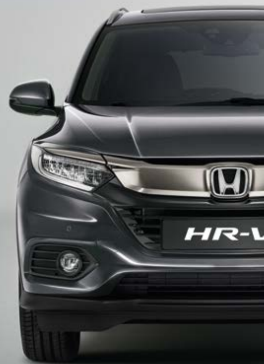
METALICKÁ MODERN STEEL