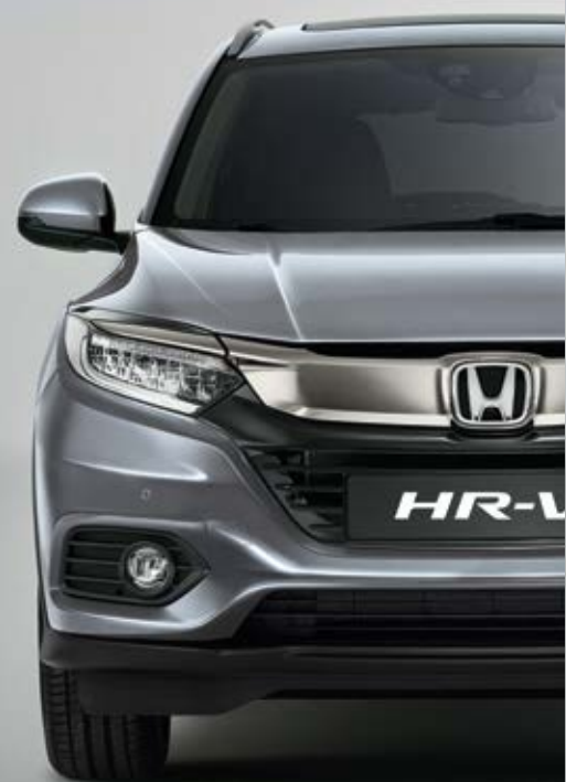
METALICKÁ LUNAR SILVER