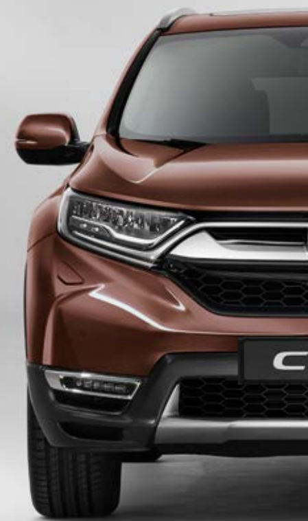
PERLEŤOVÁ PREMIUM AGATE BROWN