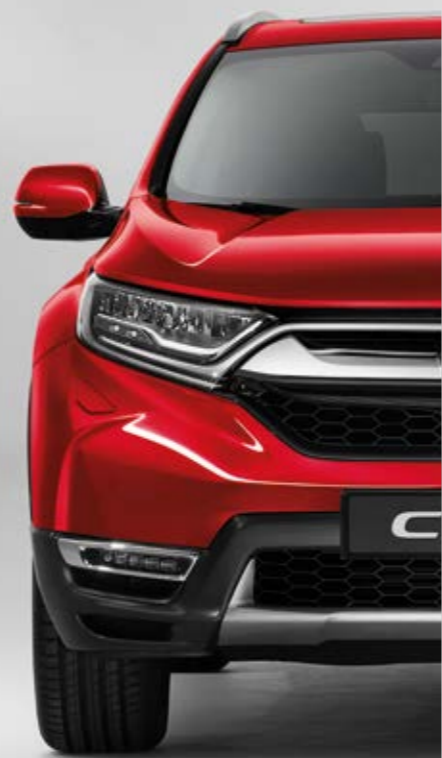
METALICKÁ PREMIUM CRYSTAL RED*

Každá farba je výsledkom úsilia o dokonalý štýl modelu CR-V. Stačí si už len vybrať svoju obľúbenú.