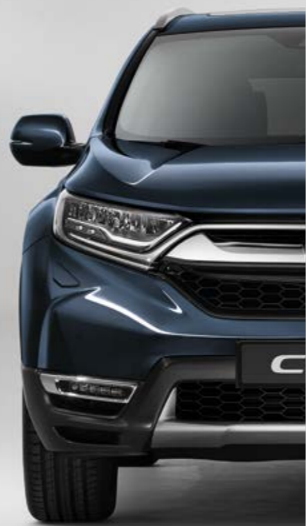
METALICKÁ COSMIC BLUE