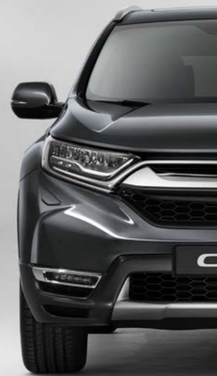
METALICKÁ MODERN STEEL