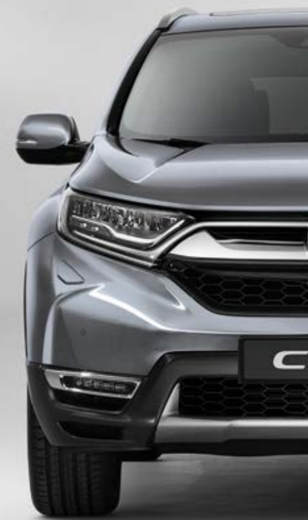
METALICKÁ LUNAR SILVER