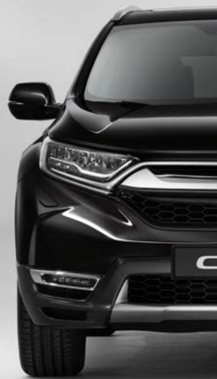
PERLEŤOVÁ CRYSTAL BLACK