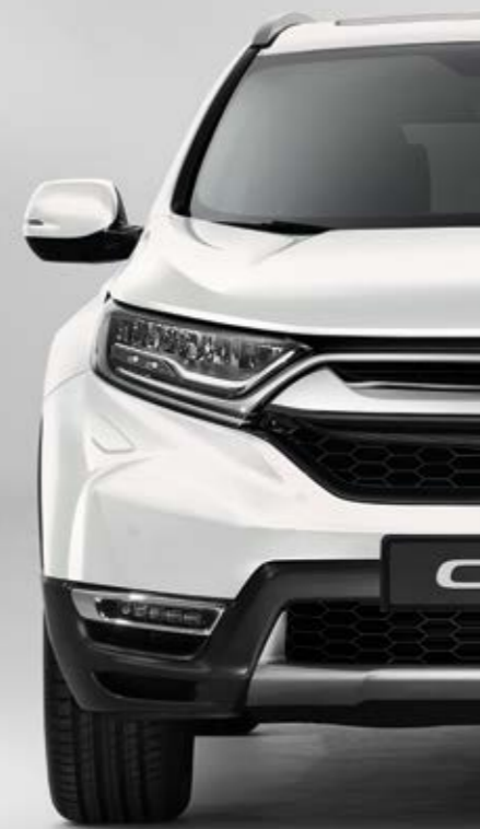
PERLEŤOVÁ PLATINUM WHITE