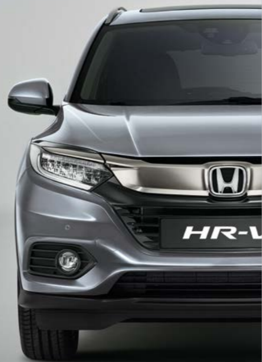
METALICKÁ LUNAR SILVER