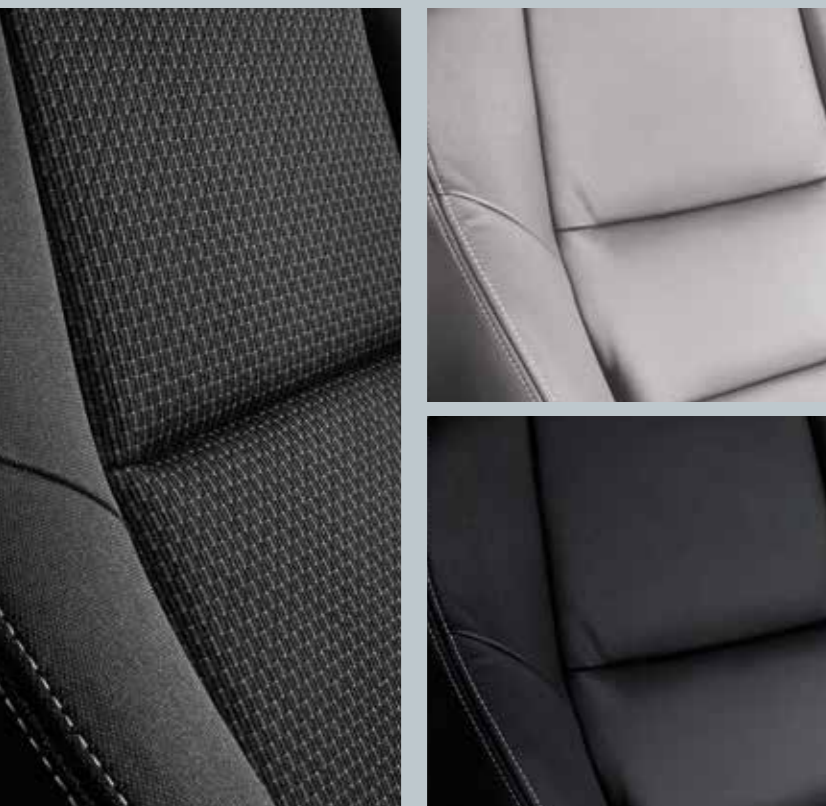
< Sivá koža

Nech si už pre svoj Civic Tourer vyberiete ktorúkoľvek farbu, môžeme vás uistiť, že naše kvalitné čalúnenie ju bude skvele dopĺňať.