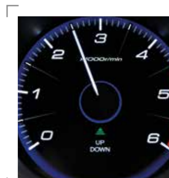
KONTROLKA INDIKÁTORA RADENIA