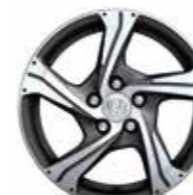
17" A 18" ARGON