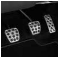
ŠPORTOVÉ HLINÍKOVÉ PEDÁLE

Balík bezpečnostných systémov, ktorý obsahuje: Upozornenie na nebezpečenstvo kolízie Systém rozpoznávania dopravných značiek Upozornenie na vybočenie z jazdného pruhu Systém pre elimináciu mŕtveho uhla Upozornenie na vozidlá blížiace sa z boku Automatické prepínanie diaľkových svetiel