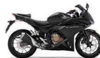
Matt Gunpowder Black Metallic