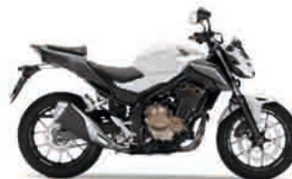
Pearl Metalloid White