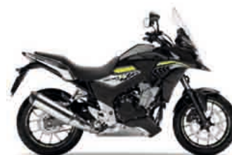
Asteroid Black Metallic