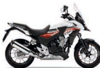
Pearl Horizon White