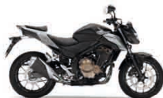
Matt Gunpowder Black Metallic

Pokiaľ ide o farby, rozhodne sme neboli skromní; máme všetky od tmavých po svetlé a tie ostatné tiež.